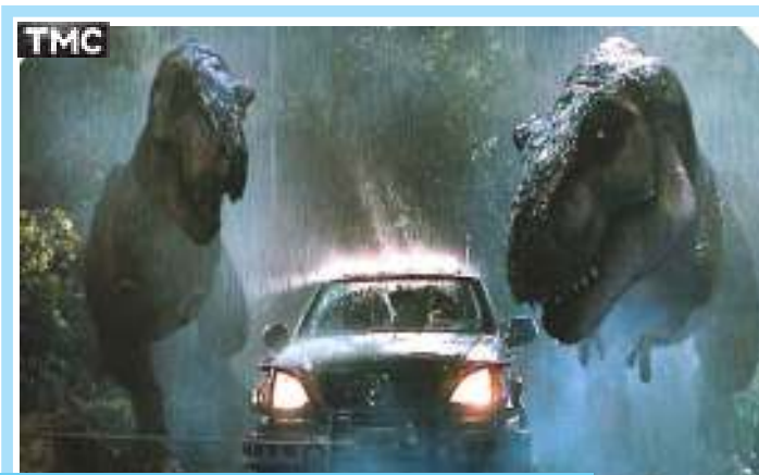
Jurassic Park 20.05