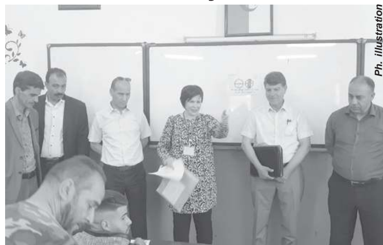
Ph. Illustration M. Bekkar

C'est parti pour le coup d'envoi des épreuves du Brevet d'Enseignement du Moyen (BEM) session juin 2022. La direction de l'éducation de la wilaya de Sidi Bel Abbès compte 13.083 candidats à cette épreuve dont 6.876 filles, répartis à travers les 69 centres d'examen, et les 484 candidats libres qui seront examinés au CEM Djilali Liabes du centre ville de SBA.