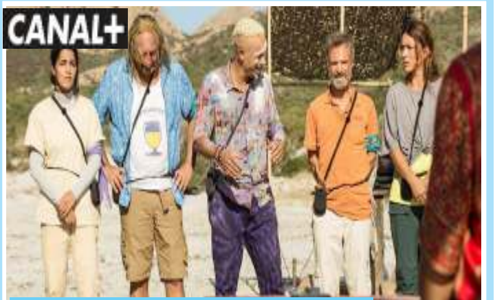
Le Flambeau : les aventuriers de Chupacabra 20.05

Ligue des Nations UEFA 2022/2023 - 2e journée. Groupe 1 Football. Au Poljud Stadium de Split en Croatie, cette 2e journée de Ligue des Nations 2022/2023 aura un petit air de remake de la finale de la Coupe du monde 2018 où les Bleus étaient devenus champions.