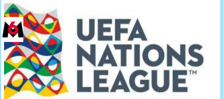
Croatie / France 20.05

Trésors enfouis. Le professeur Roger Harkness, éminent archéologue effectuant des fouilles pour trouver un temple arawak, s'écroule, raide mort, devant son adjointe Rebecca et un de ses étudiants, Ed. La cause du décès est rapidement déterminée : il s'agit d'un empoisonnement à l'arsenic, et la coupable, Rebecca, confesse très rapidement. Mais les choses sont-elles réellement aussi simples ? Parker tente d'en avoir le coeur net.