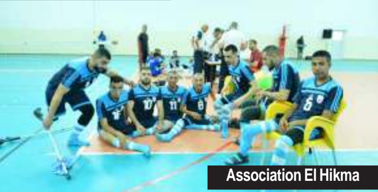
Association El Hikma