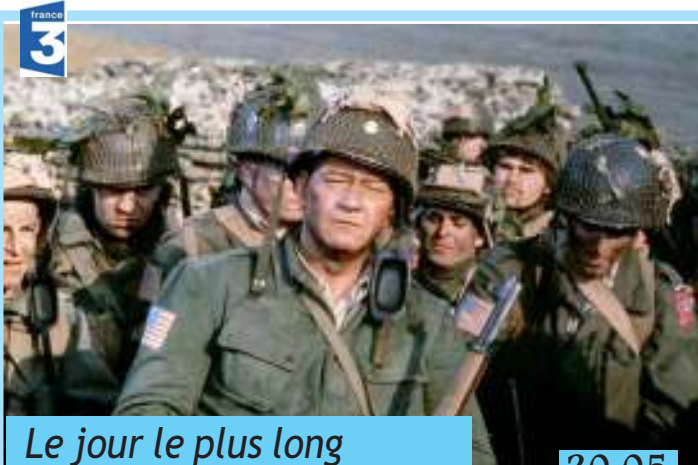
Le jour le plus long 20.05