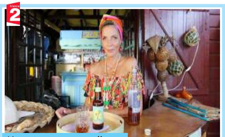
Meurtres au paradis 20.05

Le fossile d'un moustique vieux de plusieurs millions d'années a été découvert dans une mine d'ambre en République dominicaine. Pendant ce temps, deux paléontologues américains, Alan Grant et son assistante, Ellie, mettent au jour à Snakewater, dans le Montana, les restes d'un vélociraptor, di